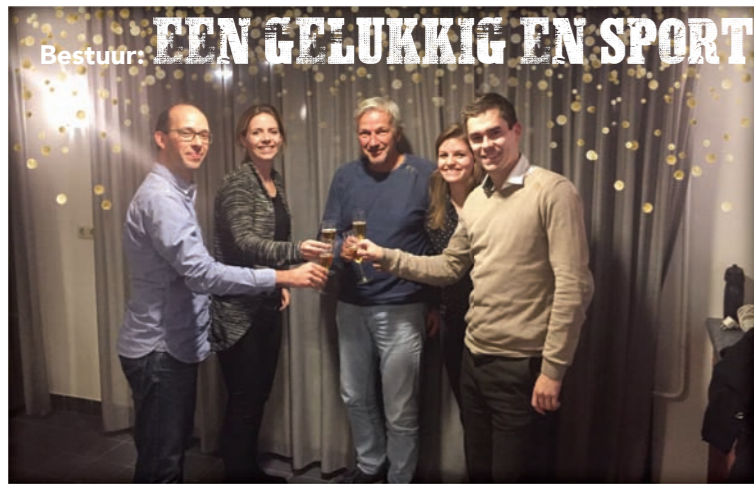
Bestuur: EEN GELUKKIG EN SPORTIEF 2018!